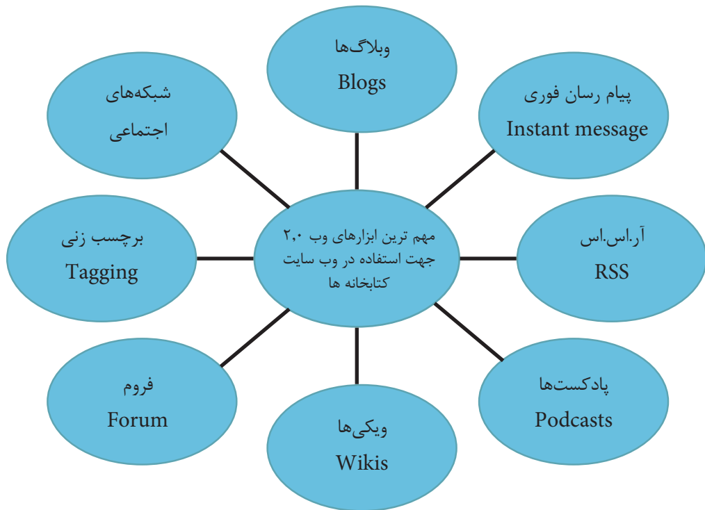
نمودار ۲. چرخه ابزارهای وب ۲ برای کتابخانه های ایران

لذا با توجه به ظهور فناوری های نوین و نقش حیاتی کتابخانه ها در ارائه اطلاعات، کتابخانه ها به پیروی و سازگاری با فناوری های روز وب مجبور هستند، از این رو باید پذیرای این فناوری ها باشند. همچنین کتابخانه ها می توانند با به کارگیری خدمات وب ۲ به سوی نسل نوین کتابخانه ها یا همان کتابخانه ۲ پیش رفته و کاربران را در امور کتابخانه ها، مانند انتخاب، سازماندهی و ذخیره اطلاعات همچون کتابخانه های دانشگاهی برتر دنیا، مشارکت دهند. از آنجائی که کتابخانه ۲، نظامی کاملاً مشارکتی را بر اساس همکاری دوسویه بین کتابداران و کاربران کتابخانه فراهم می کند و موجب بهبود خدمات کتابخانه و ایجاد محیطی تعاملی در کتابخانه ها می شود لذا پیشنهاد می شود از ابزارهای وب ۲ همچون شبکه های اجتماعی، وبلاگ ها، پیام رسان فوری، آ.ر.اس.اس، پادکست ها، ویکی ها، فروم ها و برچسب زنی در کتابخانه های دانشگاهی ایران نیز استفاده شود.